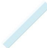
1 règle plate en plastique 30 cm